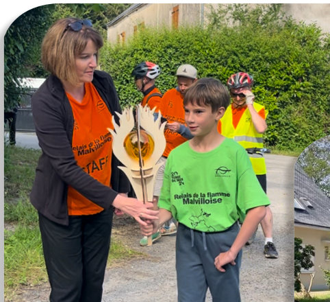
DÉPART DE LA FLAMME