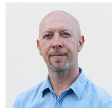
Conseiller délégué à la Culture et Vie Associative