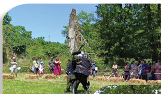
JEUX MÉDIÉVAUX AU CHÂTEAU DU GOUST