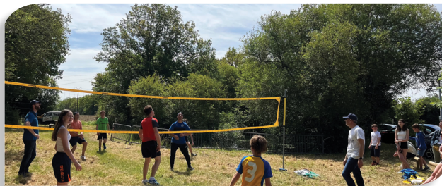
DÉFI VOLLEY À LA BABINAIS