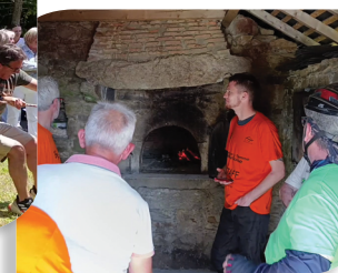
TIR À LA CORDE & ANIMATION DU FOUR À PAIN À LA TOUCHE