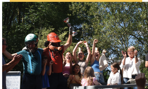
ÉQUIPE MARIO BROS, DOUBLE DASH