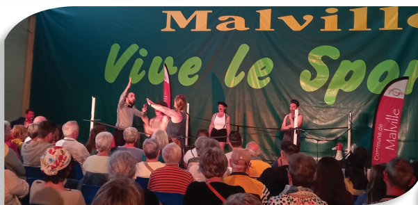
CATCH D'IMPRO AU COMPLEXE SPORTIF