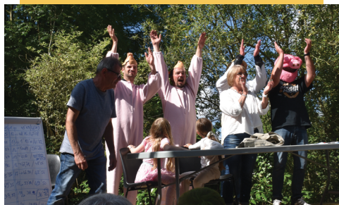
ÉQUIPE LES FRIDAY DÉTENTE