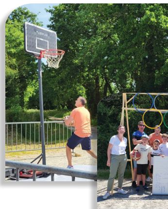
DÉFI BASKET À LA BABINAIS