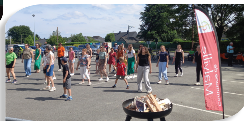
FLASH MOB À L'ARRIVÉE