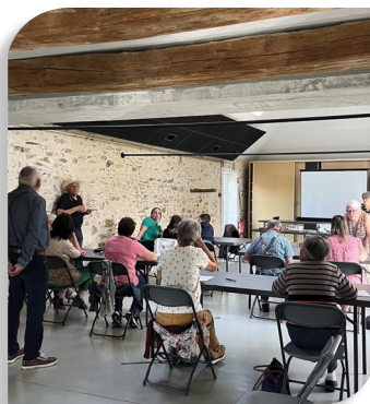
DICTÉE À L'ESPACE THALWEG