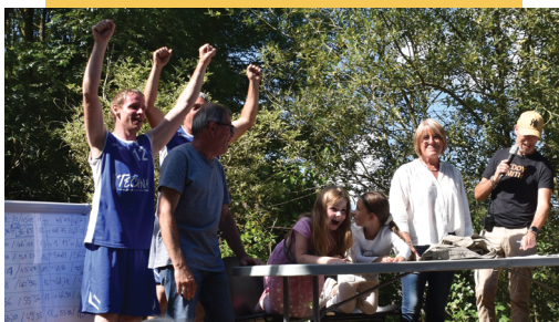
ÉQUIPE FJB U1664