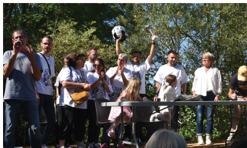
ÉQUIPE LA SAM MOBILE