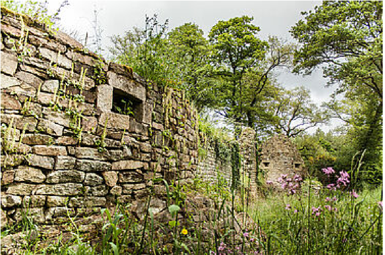
Les ruines du Château du Goust