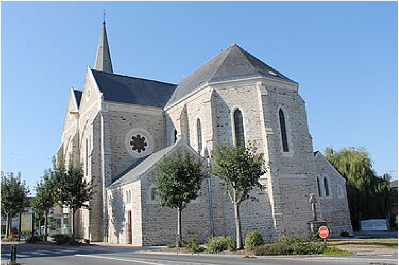
Eglise Sainte Catherine