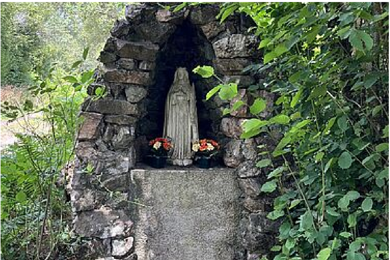
Fontaine Sainte Catherine