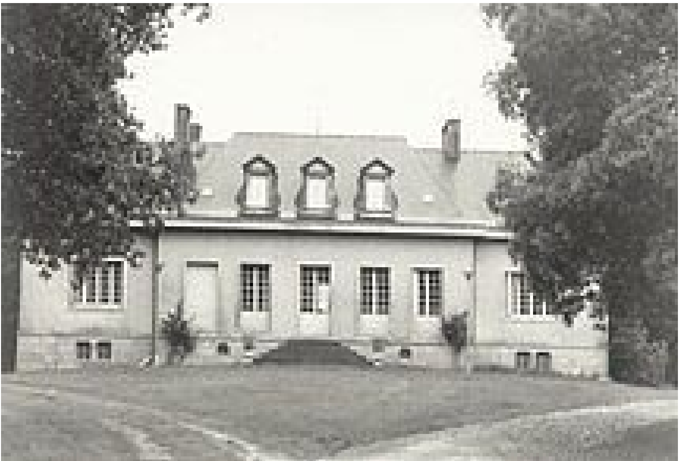
Le manoir de Bellaly