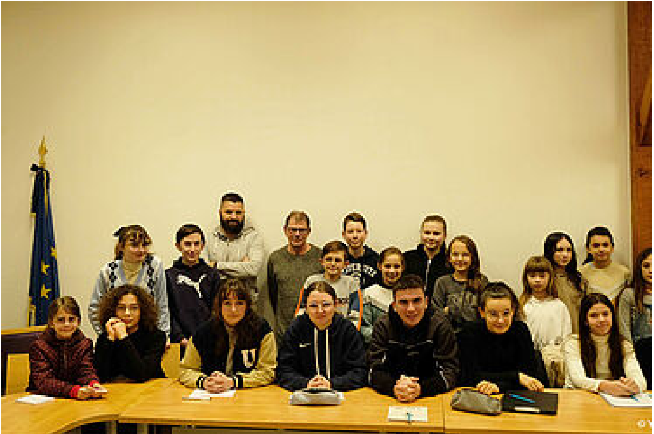
Conseil Municipal des Jeunes Malvillois