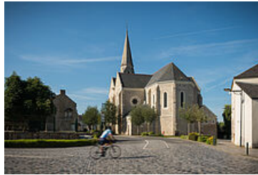
Bourq de Malville

Depuis 40 ans, la commune a subi de profondes transformations. Sa population, qui était de 860 habitants en 1968, atteint aujourd'hui les 3 343 âmes, avec une très forte proportion de jeunes (environ 60 % des Malvillois ont moins de 40 ans). Cette évolution a conduit la Municipalité à développer différents services liés à l'enfance (extension de l'accueil périscolaire et de loisirs, construction d'une école élémentaire...).