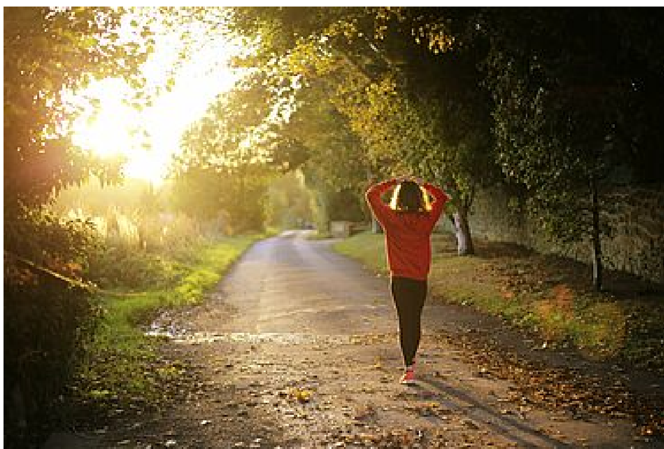
Sentiers de randonnée