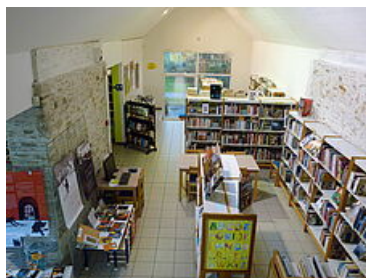
Médiathèque de Malville