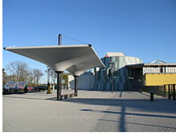
Ecole élémentaire Orange Bleue