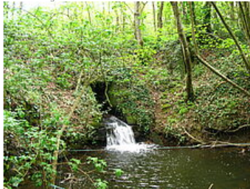
La coulée du Goust