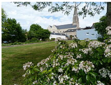
Espace Thalweg vu sur l'église