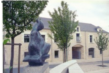
Place de l'église