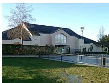
Ecole maternelle Bleu de Ciel