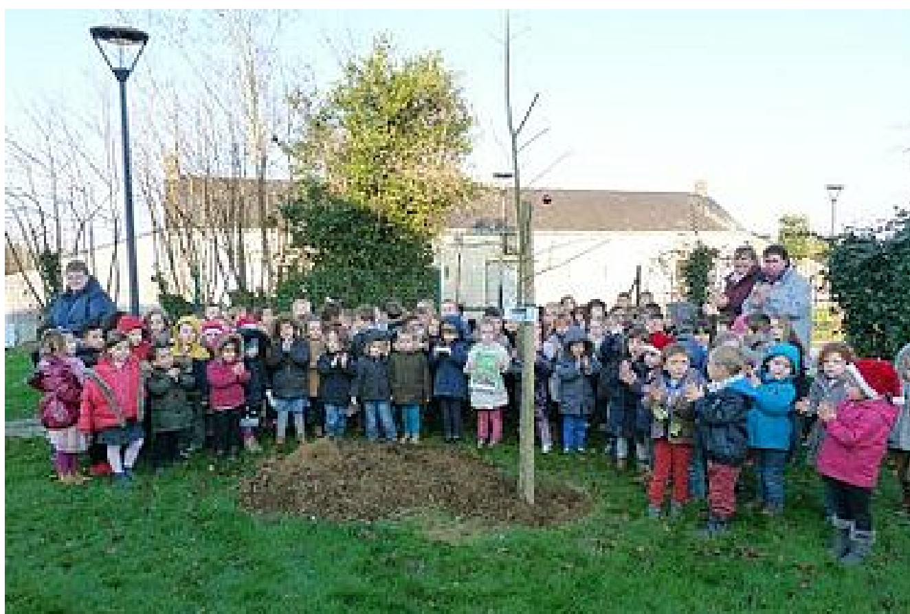
Un arbre pour le climat