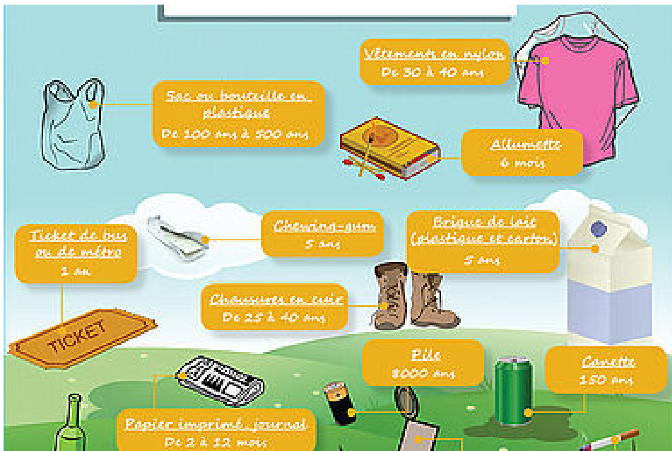
La durée de vie des déchets dans la nature