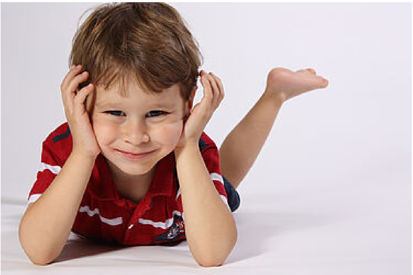
Enfance - Jeunesse : Les démarches et structures

https://www.malville.fr/mes-demarches/les-ecoles-856.html