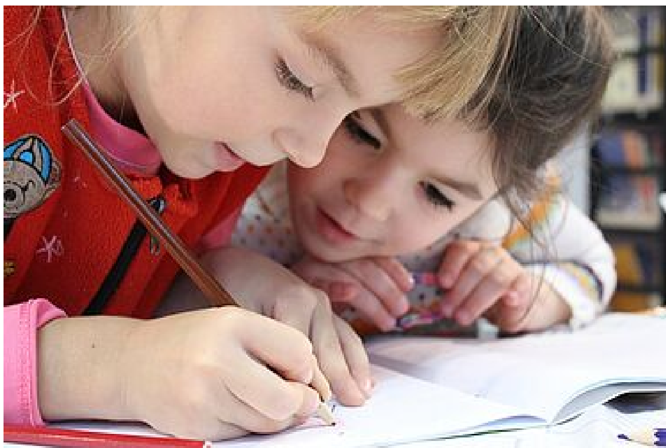
Enfance - Jeunesse