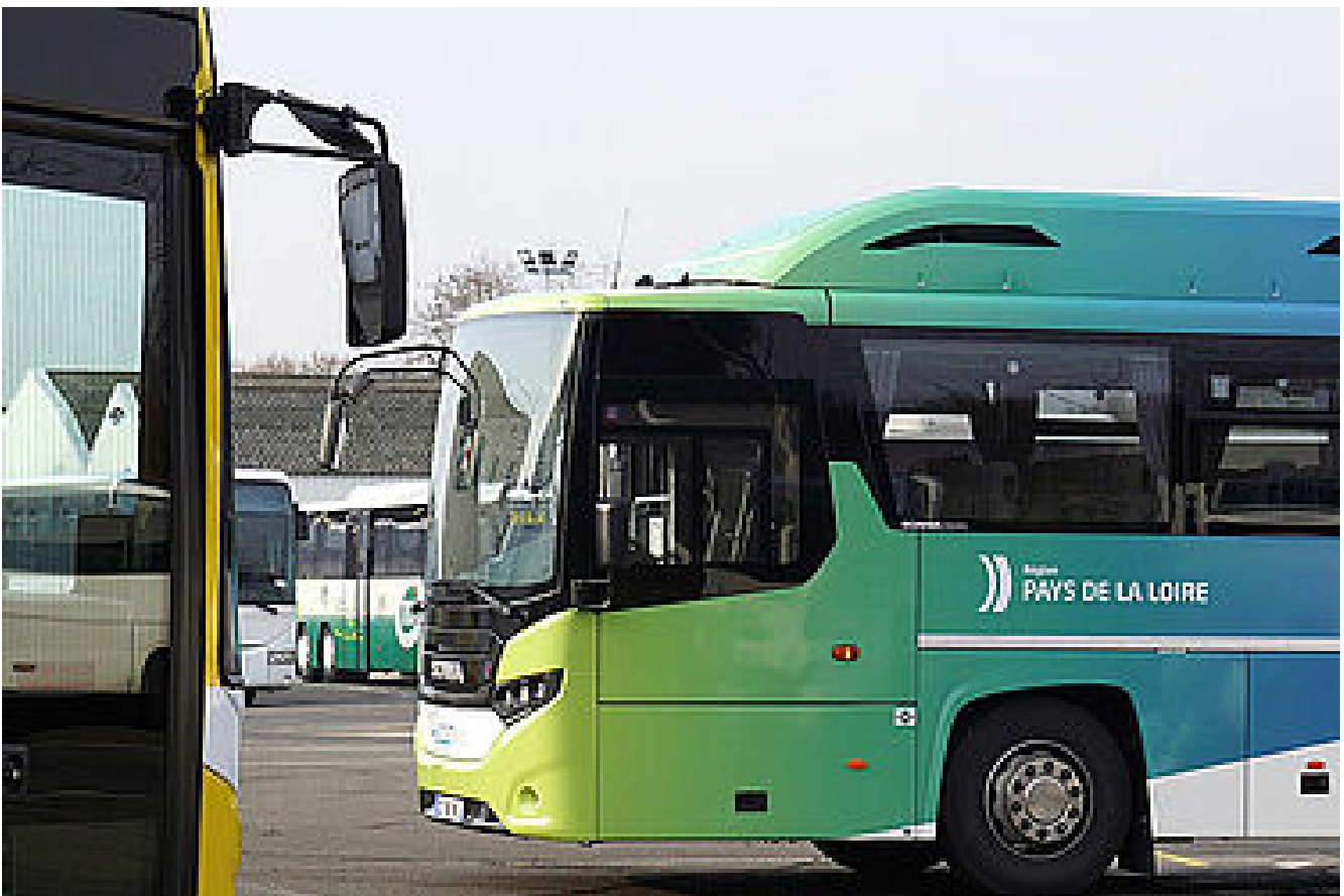
Transport - mobilités