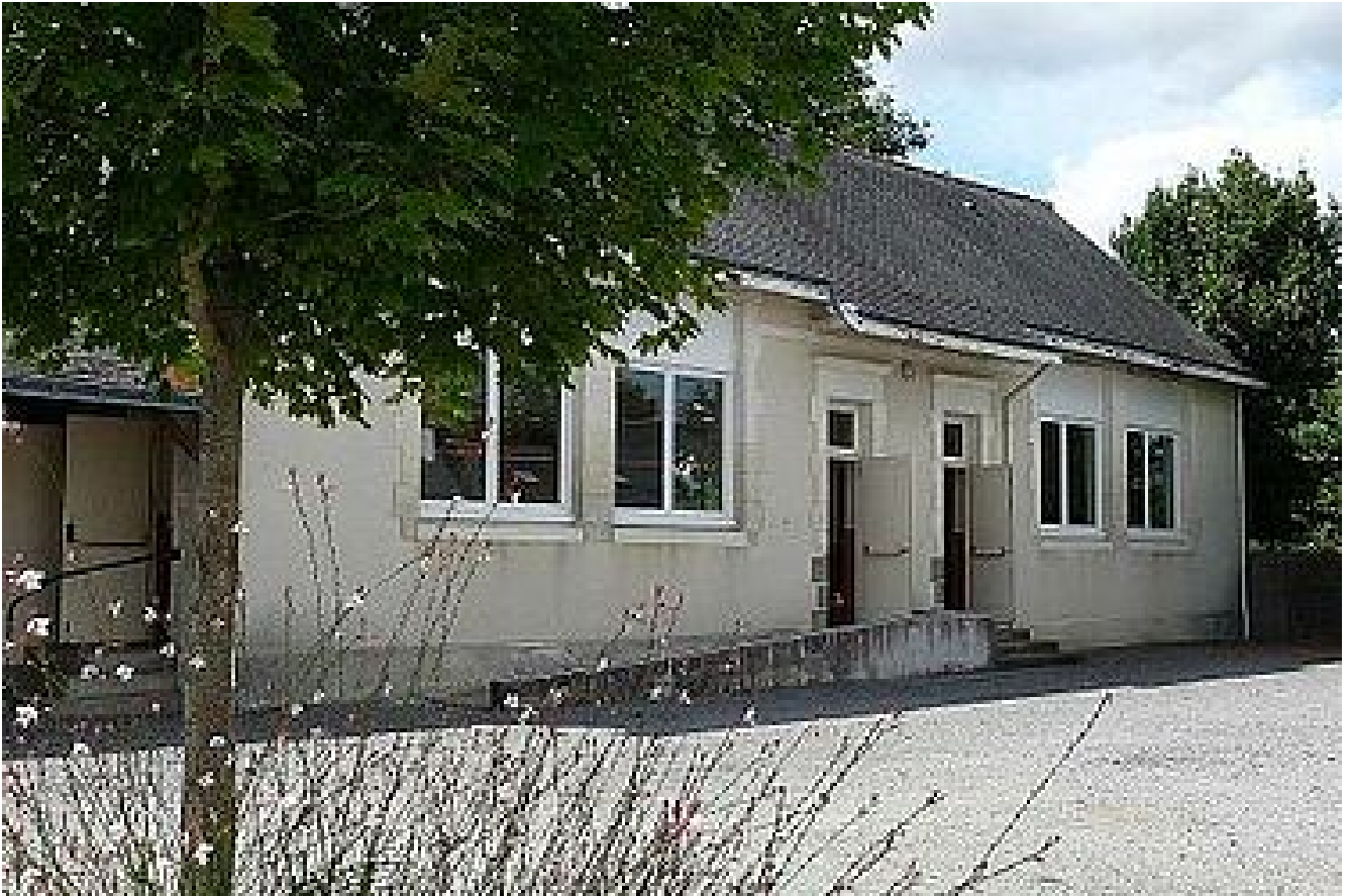
Location de salles