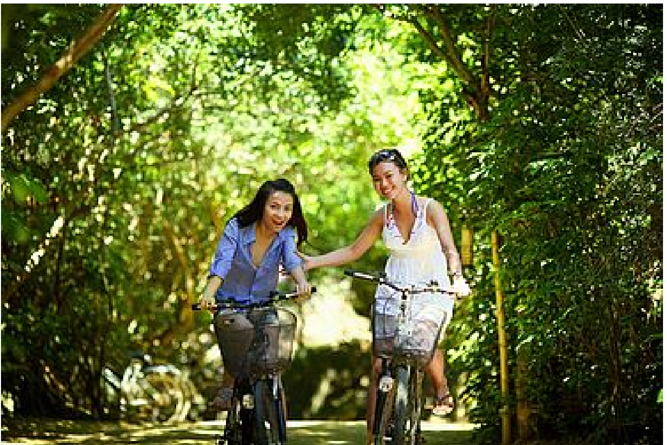
Les loisirs à Malville